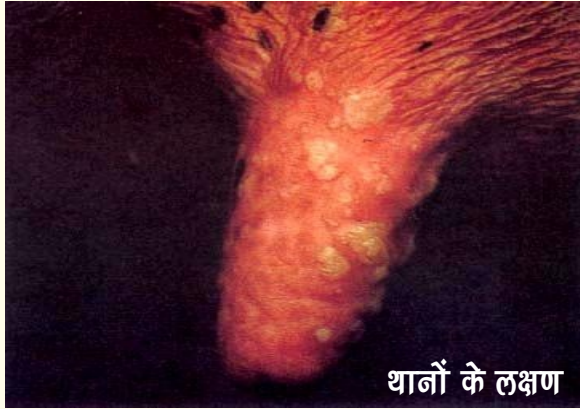
थनों के लक्षण