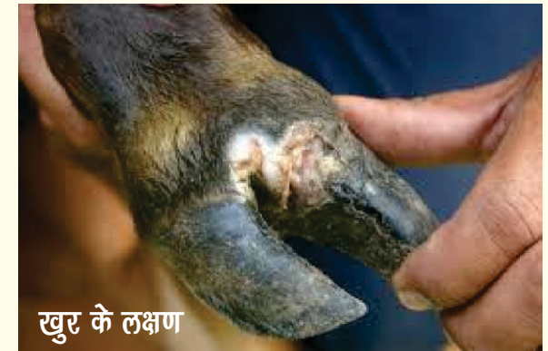
खुर के लक्षण