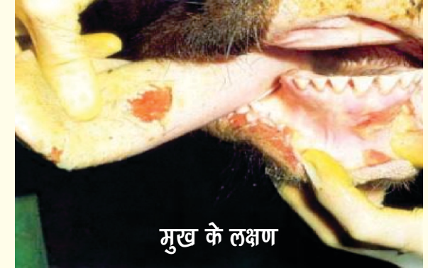
मुख के लक्षण